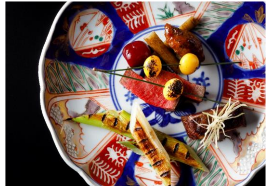
柿の葉で香りを付けた大和牛のロースト イメージ

営業時間: 朝食 7:00~10:00(L.O.10:00) / ランチ 12:00~14:30(L.O.14:30) / ディナー17:30~21:00(L.O.21:00)