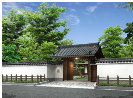
「ホテル外観」イメージ

紫翠 ラグジュアリーコレクションホテル 奈良の最新情報はホテル公式ホームページ( www.suihotels.com/shisui )にてご覧いただけます。