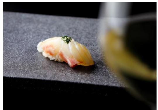
昆布締め、甜茶 イメージ

営業時間: ランチ 12:00~14:30(L.O. 14:30) / ディナー17:30~21:00(L.O. 21:00)