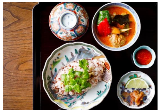
大和橘とスパイスを使ったレッドチキンカレー イメージ